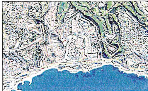
Vista de Nueva Torrequebrada.