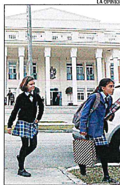
Alumnos del MIT School.

En los años 2009 y 2010, cuando se admitieron los actuales socios trabajadores del colegio, se les informó de manera oral y por escrito (así venía en los anuncios internet y periódicos buscando socios) que tenían tres años como mucho para obtener el First Certificate of English (B2), puesto que el MIT iba a ser un colegio bilingüe. Según Díaz, en los primeros cuatro años algunos docentes se sacaron este título «pero otros ni siquiera hicieron el más mínimo intento, pese a recordárselo pe-