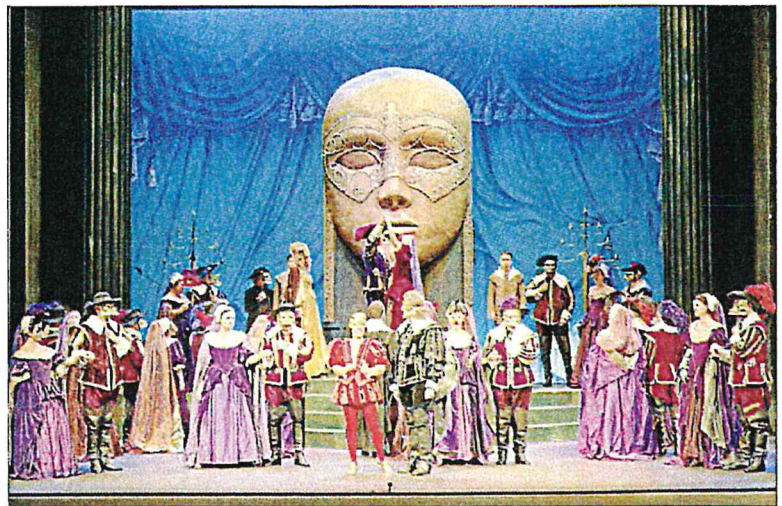
El montaje de la ópera «Un ballo in maschera».

► EL EQUIPO DE «TORO» , la nueva película de Kike Maillo, protagonizada por Mario Casas, Luis Tosar, José Sacristán e Ingrid García Jonsson, se trasladó el pasado miércoles al colegio MIT School Málaga, elegido por su original arquitectura. Mario Casas e Ingrid G. Jonsson fueron los protagonistas de esta parte del rodaje, que hoy se traslada a la Alameda y La Malagueta.