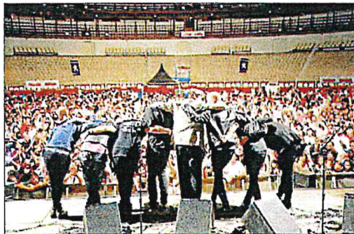
Detalle del concierto del sábado.

Fuentes de la organización recalcaron ayer en un comunicado el éxito de la convocatoria, que, insistieron, consolida a Málaga como capital de España en la lucha contra el Síndrome de Rett.