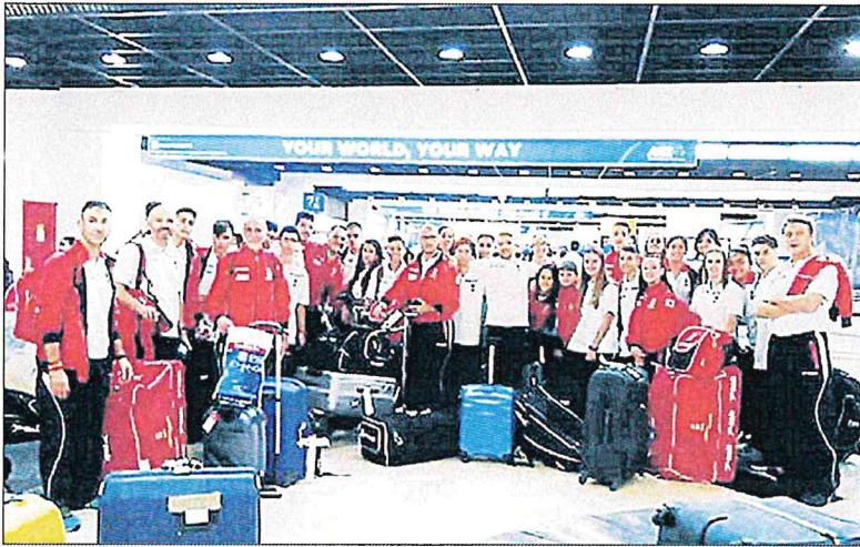
La expedición española, a su llegada al aeropuerto de Yakarta.

► Se disputa en Yakarta del 12 al 15 en categoría cadete, júnior y sub'21