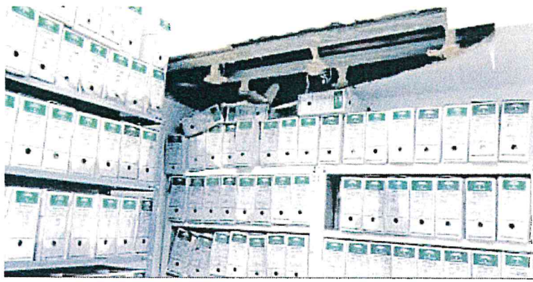
Estado que presentaba ayer el archivo del juzgado de Torrox con los documentos empapados.

La rotura de una tubería en un restaurante colindante al juzgado de Torrox causó durante la pasada madrugada filtraciones de agua en el edificio judicial. Según fuentes de la Junta de Andalucía, la inundación de este inmueble provocó desprendimientos en parte del falso techo del archivo y acumulación de agua en esta sala del inmueble de la plaza de la Hoya. "En ningún caso haya sido el techo de la estructura del inmueble", resaltaron. El incidente se produjo durante la madrugada, cuando "el juzgado se encontraba cerrado" y "sin nadie en su interior".