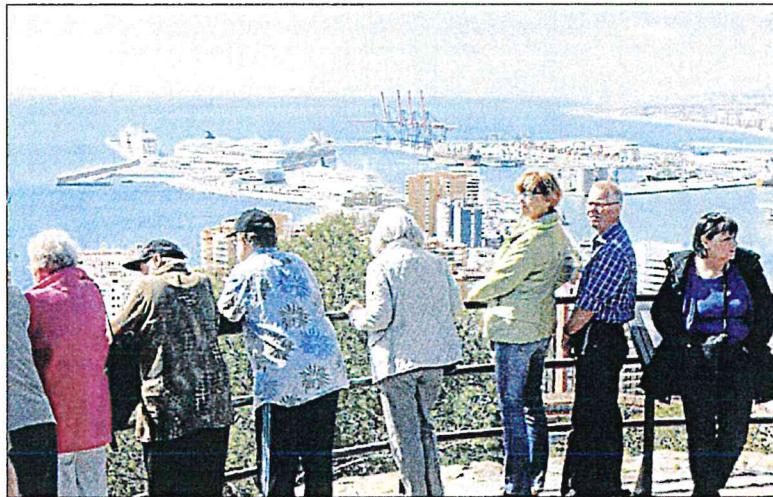
Turistas de cruceros en Málaga. ARCIENEGA

Celebrity Reflection, de la compañía americana Celebrity Cruises, perteneciente al grupo Royal