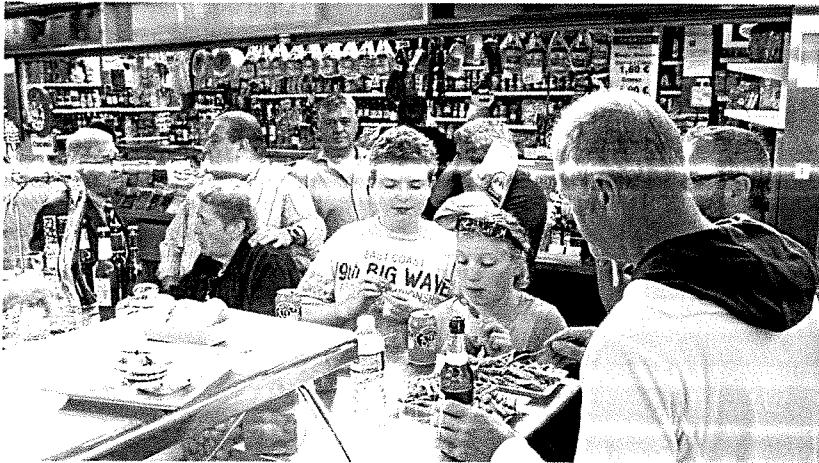
Una medida de este tipo tiene que ser aprobada por la Junta de Gobierno Local.

La edil de Reactivación Económica afirma que «no entra en la filosofía del recinto», cuya actividad principal es «la venta de productos frescos»