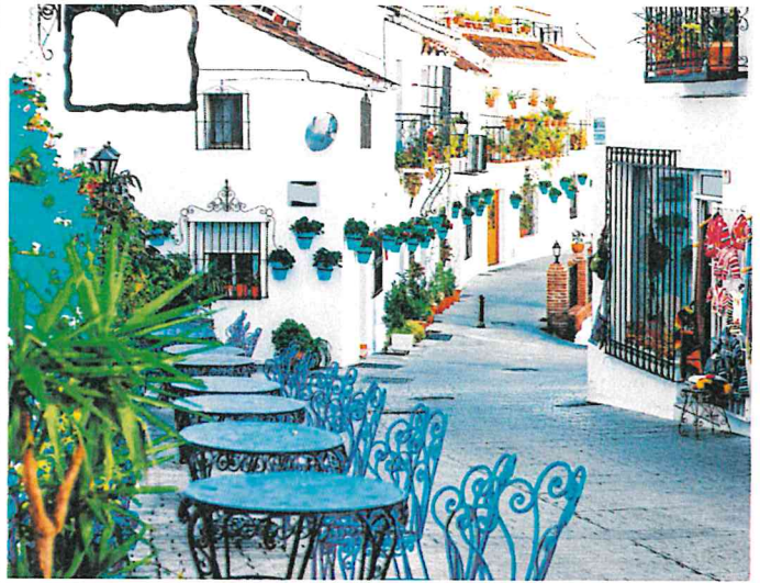
MIJAS: The village won't go thirsty under the new measures.