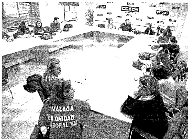
Monitoras afectadas reunidas la pasada semana en la sede de CCOO.