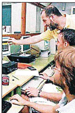
Aula de formación profesional.

Los ciclos formativos de Grado Superior de nueva impartición serán Gestión de Ventas y Espacios