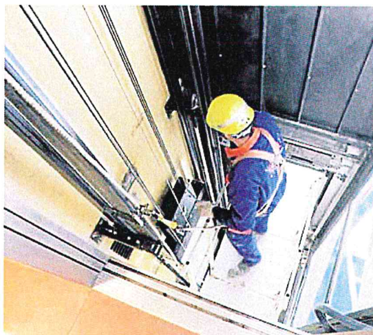
El IMV se encargará de ejecutar las obras de los ascensores.