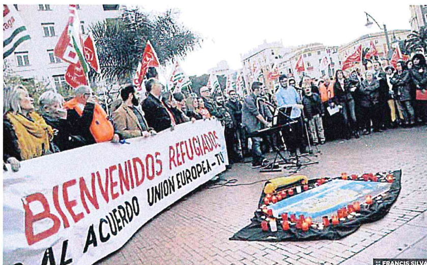
:: FRANCIS SILVA

Alrededor de 300 malagueños se concentraron ayer en la plaza de la Marina en protesta por las políticas europeas sobre refugiados con el lema 'No queremos esta Europa'. El acto estuvo encabezado por los partidos de izquierda y los sindicatos CC OO y UGT, así como la ONG ASPA. En la cita se pudieron ver frases simbólicas en favor de los refugiados y contrarias al acuerdo UE-Turquía. Los portavoces de los partidos de izquierda con representación en el Ayuntamiento mostraron su rechazo total al pacto.