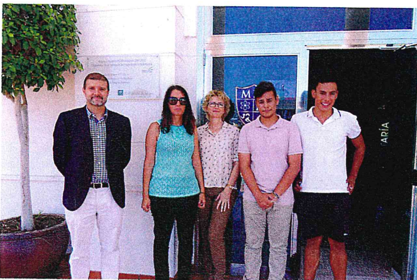
Estudiantes portugueses que realizan sus prácticas en el Colegio MIT.

Se trata de una iniciativa financiada por el Ministerio de Ciencia, TIC y Planificación del Gobierno Coreano que ofrece oportunidad de expandirse en Asia a través de Corea como punto de apoyo para desarrollar una cooperación internacional; networking con las mayores empresas de Corea (Samsung, Hyundai, LG, SK, KT, NHN, etc.), facilitando la posibilidad de establecer negocios con algunas de las firmas más innovadoras del mundo de la industria tecnológica; subvención de hasta cien mil dólares y posibilidad de obtener inversión adicional de un importante acelerador de Corea; acceso a espacio de oficinas y proyectos en Pangyo Techno Valley, un parque de innovación importante que acoge a las startups más prometedoras y grandes empresas del país; networking, tutorías y sesiones de capacitación con expertos locales e internacionales.