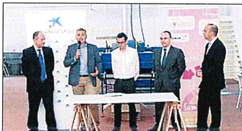
Detalle de la presentación de la iniciativa. LA OPINIÓN

De acuerdo con las mismas fuentes, el proyecto ha implicado la reinversión de las instalaciones, que han sido diseñadas para acoger dos aulas de formación y un taller con la última tecnología en la disciplina de la serigrafía. Este cen-