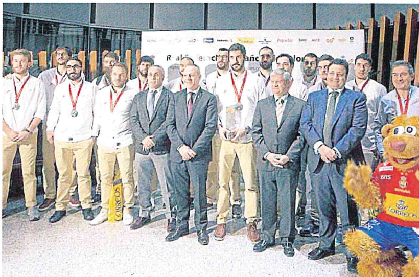
La selección de balonmano posa en la sede de Correos, uno de sus patrocinadores.

España sucumbió en la final contra Alemania con una sensación de impotencia refrendada por los 'Hispanos' un día después. «No conseguimos dar continuidad, parecía que ellos estaban más de seis en defensa», reconoce el seleccionador Manolo Cadenas. «Estábamos seguros de que íbamos a jugar nuestro mejor partido para ser campeones pero no pudimos canalizar en la cancha ese deseo. No hay nada más que reprocharse, tal vez pudo más el deseo que la soltura que debíamos tener para jugar en ataque», analiza el preparador tras respirar hondo. «Para el equipo no fue justo terminar de esta manera porque no dimos todo lo que podemos dar. Fue un partido extraño por nuestra parte», insiste Raúl Entreríos. «Hemos tenido traumas de partido con muy buen juego con fases en que hemos sufrido un montón. Al final el segundo puesto puede ser un buen broche para este campeonato», recuerda Pérez de Vargas.