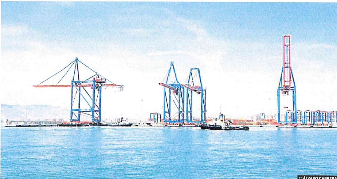
:: ÁLVARO CABRERA