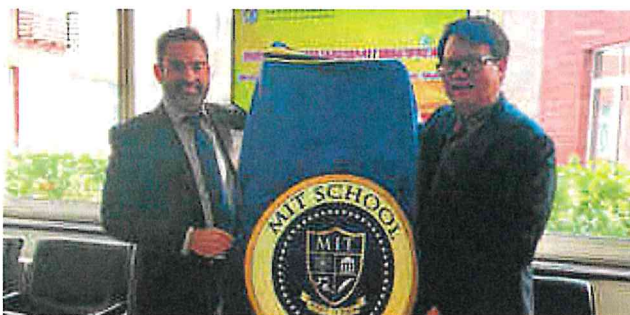
▲ Firma del acuerdo con la BFSU de Beijing el pasado 24 de noviembre.

te el 70% de la enseñanza en inglés desde Infantil, para ir subiendo ese porcentaje hasta el 95% en Secundaria, pero dos idiomas no son suficientes hoy en día. Hacen falta más idiomas, y por eso incluimos, desde 2010, el chino desde los tres años y el alemán desde los ocho años. China ya es en la práctica la primera potencia económica mundial y los intercambios laborales, comerciales y de todo tipo con el resto del mundo aumentan cada hora.