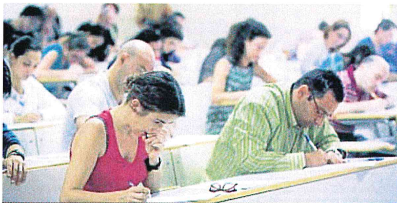
Aspirantes al cuerpo docente en el examen de la anterior convocatoria, en junio de 2014.

● Con la constitución de tribunales y la presentación de méritos se empieza el proceso que mañana continúa con el examen escrito